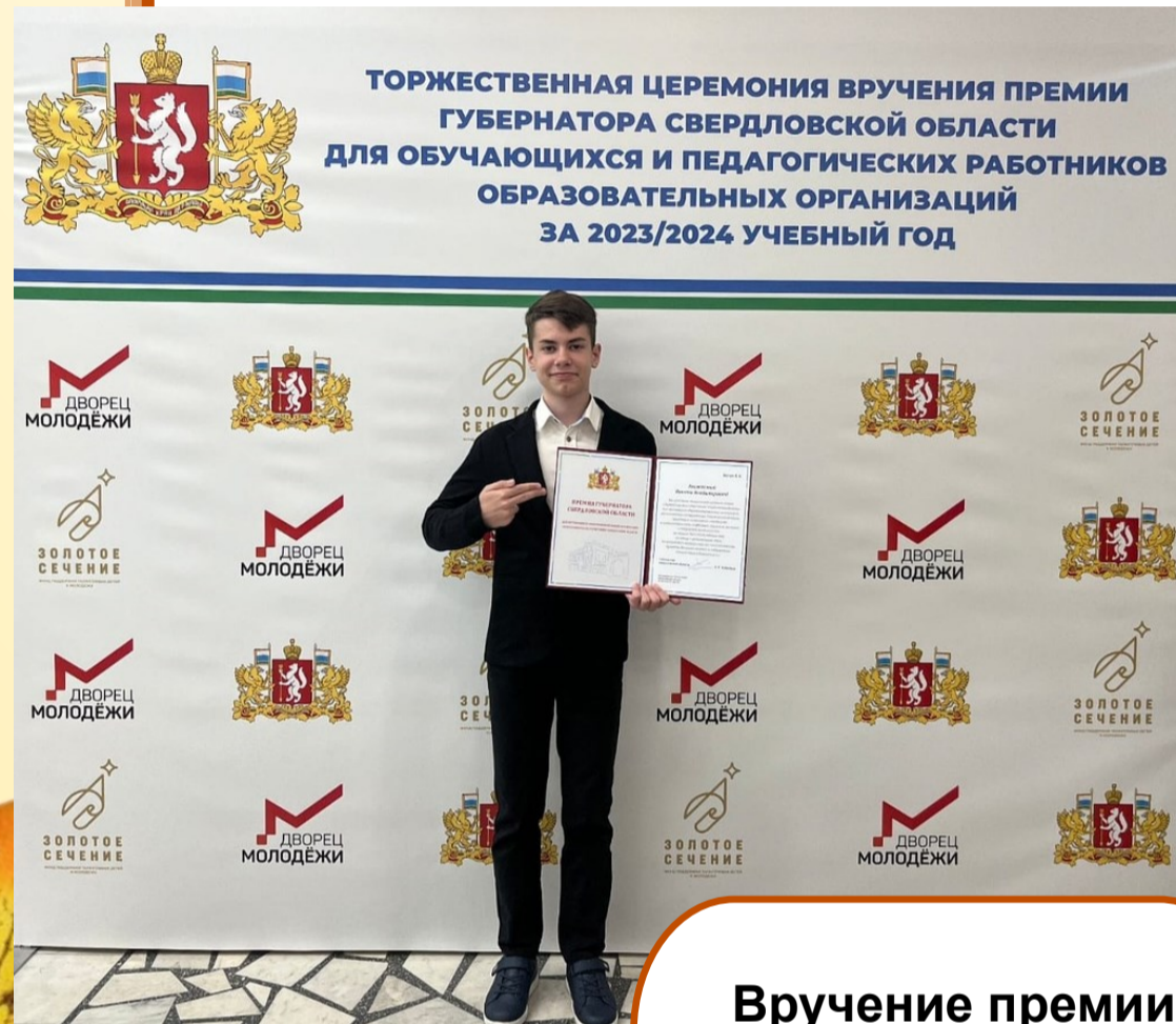
Вручение премии Губернатора области