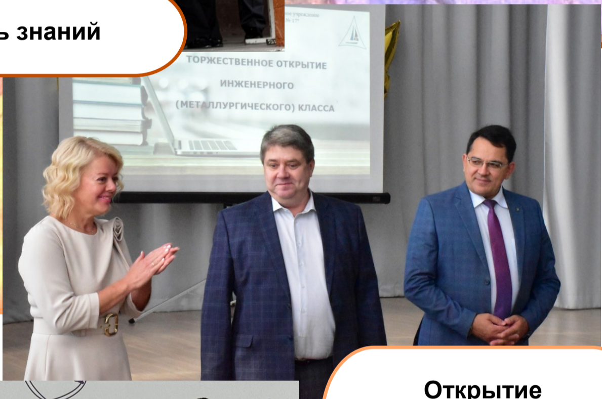
Открытие инженерного класса