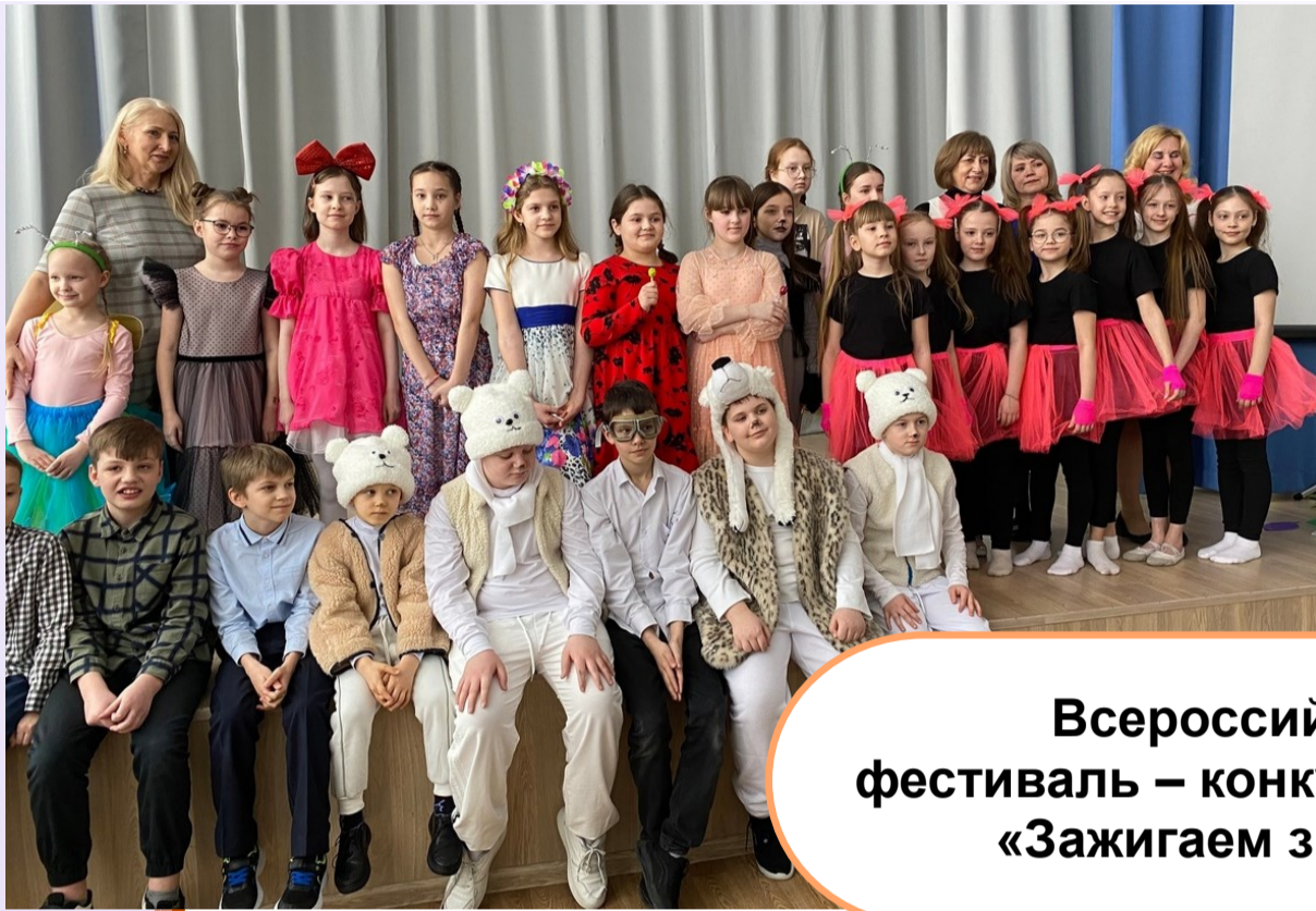
Всероссийский фестиваль – конкурс искусств «Зажигаем звезды»