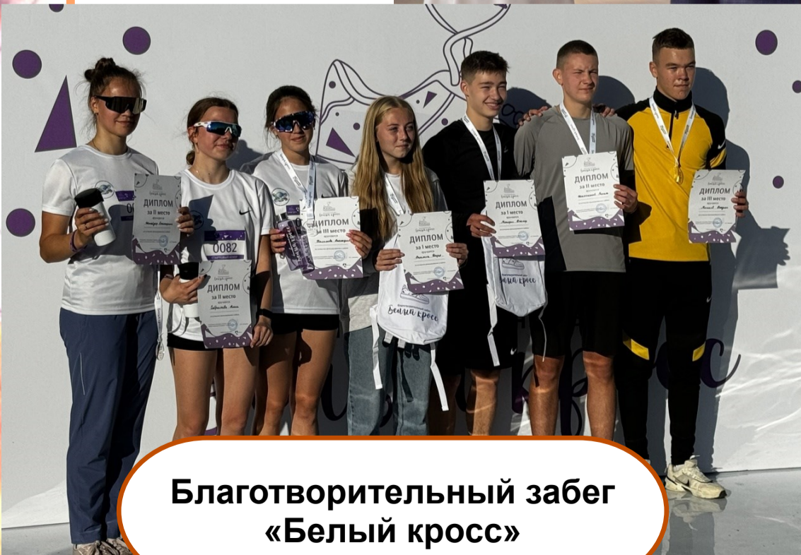
Благотворительный забег «Белый кросс»